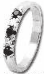
Milanesa Ring 0803 2,5 crt. met 400,- Nu met 0,10 crt. met 280,- Nu 499,-