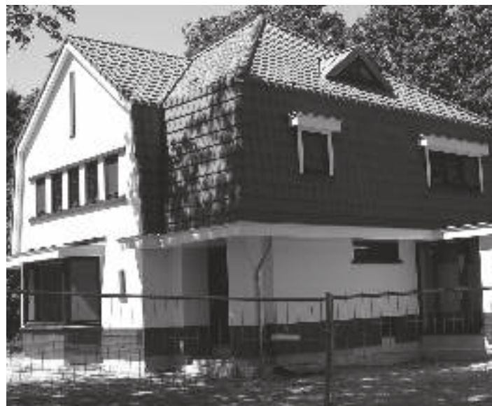
Hoge Limiet 187 Nieuw: "op nagenoeg dezelfde wijze" herbouwd.