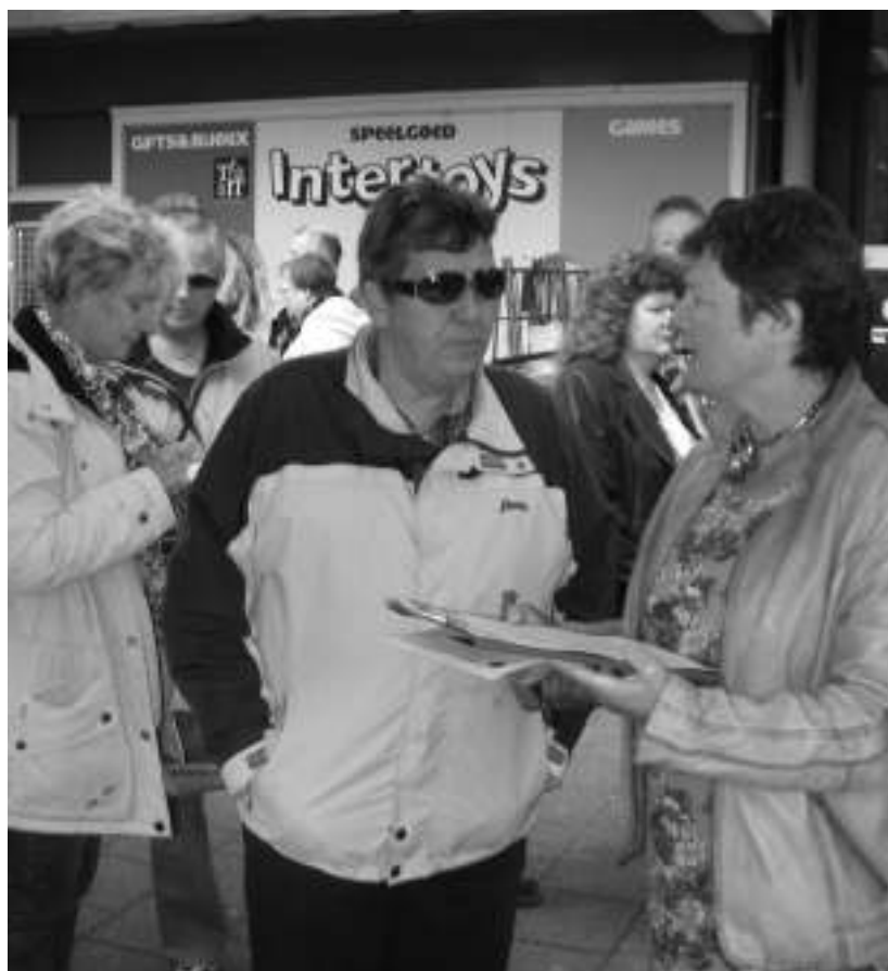
LiS-vrijwilligers enquêteren tijdens de voorjaarsmarkt