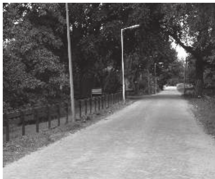
Hoge Limiet: voor zo'n plaatje hoeft u helemaal de wijk niet uit!

Ik ben benieuwd naar wat u hiervan vindt.