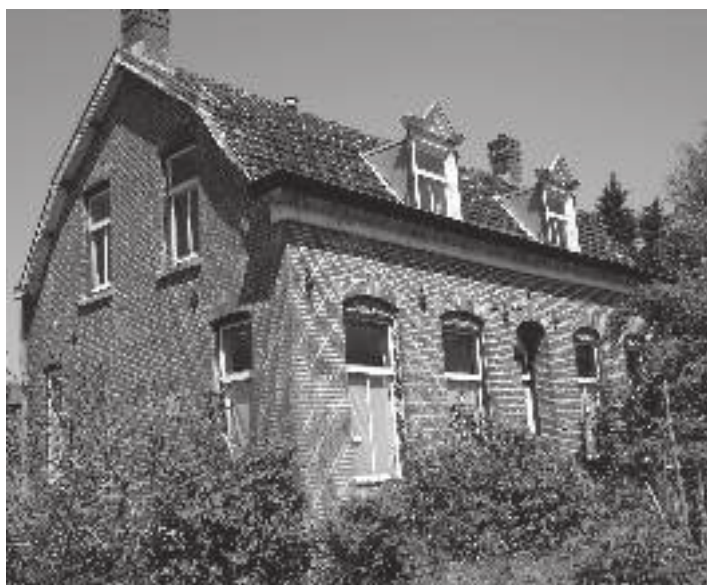
Hoge Limiet 15: slopen of restaureren en met passende aanbouw geschikt maken voor een nieuw bestaan?