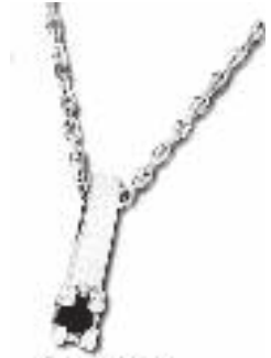
Hanger D'Elite Basic met 0,10 crt. met 280,- Nu 149,- Bijzet met 1,1 crt. met 500,-