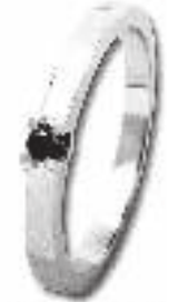
Ring D'Elite Basic met 0,10 crt. met 280,- Nu 285,-