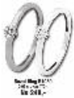
Roest Ring R1001 0,75 crt. met 437,- Nu 248,-