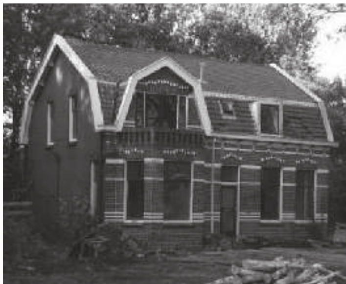
Hoge Limiet 187 Oud: de sloper staat klaar om met zijn werk te beginnen.