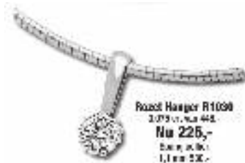
Roest Hanger R1098 2,075 crt. met 448,- Nu 226,- Bijzet met 1,1 crt. 500,-