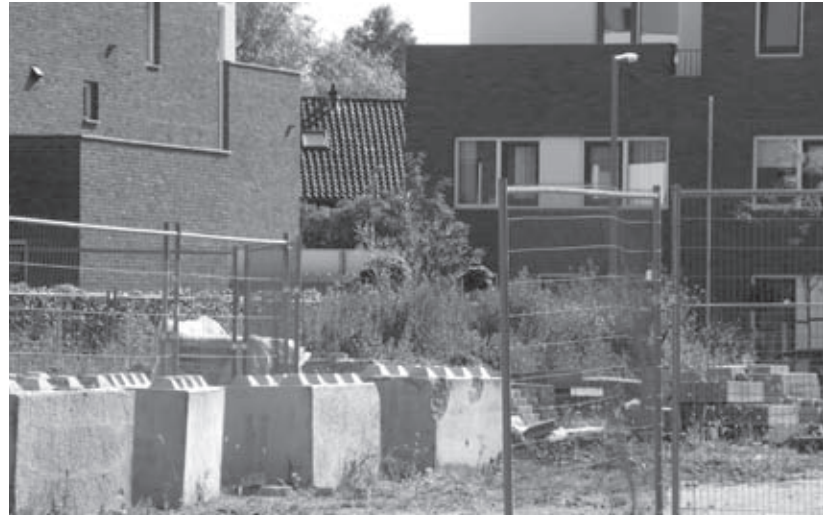
Het is een rommeltje in en om de nieuwbouw

De behandeling van de verkeerssituatie in deze wijk met veel jonge kinderen riep bij diverse bewoners de nodige emotie op. Met name in de Dalkruidstraat is door de aanwezigheid van Albert Heijn sprake van een grote verkeersdruk. Daarbij wordt bovendien de snelheidslimiet van 30 km. frequent genegeerd. Com.wonen en de deelgemeente erkenden het probleem en zegden toe de bewoners te betrekken bij het nader uitwerken van het buitenruimteplan voor het gebied. De deelgemeente bleek echter niet mee te willen of te kunnen