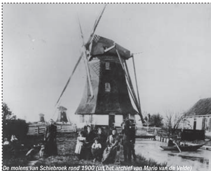
De molens van Schiebroek rond 1900

Om het benodigde geld hiervoor bij elkaar te krijgen gaan de vrijwilligers van het Kunstfestival de komende tijd op pad om bedrijven, fondsen en instellingen te overtuigen dit plan mede te financieren. Daarom vragen we geen geld van u. Maar uw steun , als bewoner van Schiebroek, hebben we heel hard nodig! Als u De Molen van Schiebroek een leuk idee vindt, steun ons dan door onderstaand formuliertje in te vullen of een steunbetuiging te e-mailen naar info@kunsthfestival.nl. MET ELKAAR MAKEN WE SCHIEBROEK (NOG) LEUKER!